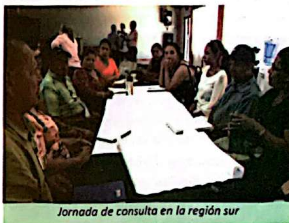
Jornada de consulta en la región sur

En esta Región la consulta se realizó de forma conjunta CDH y RDS con amplia participación de la base comunitaria.