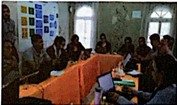
Sistematización de Experiencia V4CP – FOPRIDEH

A nivel del contexto se hablaba sobre la afectación del país por factores relacionados a la migración, la impunidad, la corrupción y la frágil gobernanza existente. Se esperaba movimientos en el gabinete de gobierno, lo cual se dio al final del año. También se analizaba la situación de los fondos de inversión al impulso y promoción de la SAN a partir de fondos de donación y préstamos, al igual que la voluntad política de los actores clave para realizar los cambios necesarios en el sistema SAN y priorizar las inversiones en este sector.