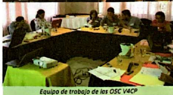
Equipo de trabajo de las OSC V4CP