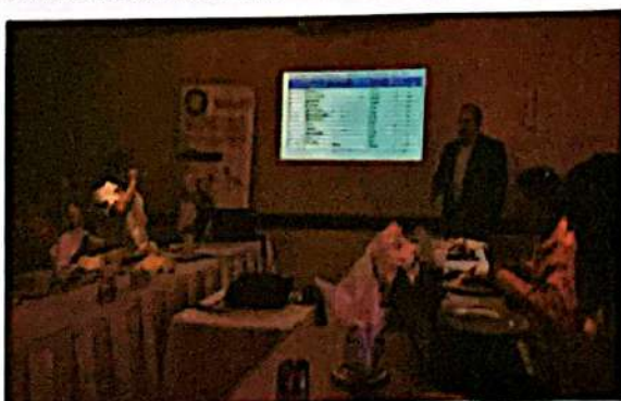
Reunión de la plataforma Interinstitucional de la cadena de valor de estufas mejoradas

Los resultados de este estudio fueron la punta de lanza para la incidencia en el seno de la recientemente creada PIEM resaltando la necesidad de fortalecer capacidades temáticas y establecer una ruta estratégica para orientar y articular los esfuerzos para la implementación sostenible de las EM.