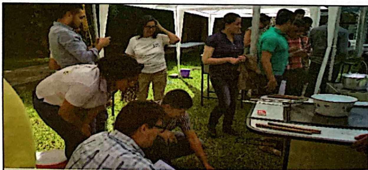
Taller de formación entre pares sobre ER con énfasis en EM, liderado por HdH y F. Vida

HdH entró en un proceso de aplicar lo aprendido durante el fortalecimiento de capacidades centrando su accionar en el tema de incidencia. El abordaje se mantuvo en la sensibilización a organizaciones comunitarias, municipalidades y mancomunidades promoviendo la adopción de Estufas Mejoradas (EM). Incluso se participó en reuniones de Corporación Municipal, cabildos abiertos y ferias regionales con el objetivo de concientizar a la población sobre la importancia y beneficios de las EM, así como promover la coordinación entre actores para impulsar esta tecnología dentro de la población rural hondureña, en especial el sector más vulnerable en cuanto a acceso a la energía se refiere.