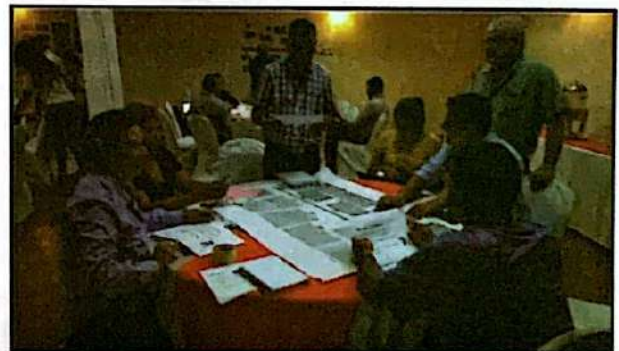
Jornada de Fortalecimiento de Capacidades del programa Asociación voz para el Cambio

Además, talleres de formación entre pares liderados por las OSC socias para fortalecerse entre ellas mismas. Tópicos para destacar fueron: