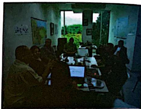
Primera Reunión de acercamiento para la conformación de la plataforma, abril 2017

Este espacio se formó bajo un carácter de participación voluntaria y sin ningún tipo de compromiso financiero más que el interés en la temática por parte de sus miembros.