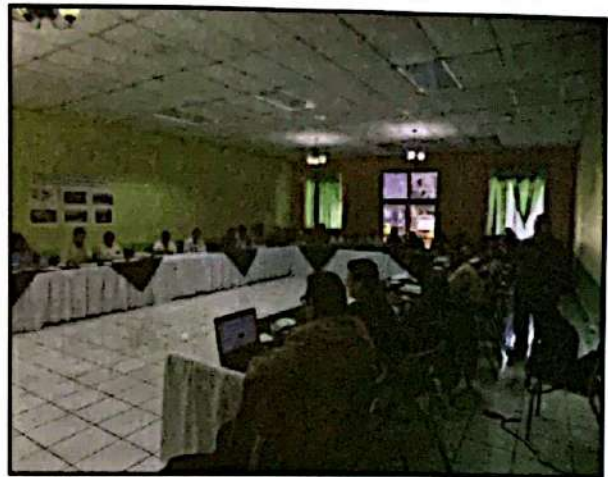
Socialización de V4CP con organizaciones regionales

Cabe mencionar que HdH se movilizaba desde su sede en San Marcos de Ocotepeque hasta los sitios donde se realizaban las reuniones, muchas veces en la Capital de la República. Esto implicaba esfuerzos en tiempo, recursos humanos y financieros, por lo que se dificultaba mantener la representación de HDH. Sin embargo, HdH hizo todo lo posible para asegurar