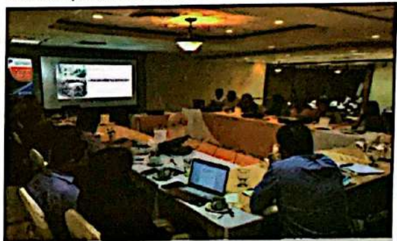
Presentación del primer borrador de propuesta de ENAEM ante la Plataforma Interinstitucional

HdH ya posicionado y empoderado de toda la información generada a la fecha, fue considerado por la PIEM+ como parte del comité formado para la revisión de documentos oficiales como el Estudio de Monitoreo Reporte y Verificación MRV, a solicitud de la Dirección Nacional de Cambio Climático (DNCC), la construcción participativa de la Nota Concepto de la NAMA de EM, el Comité Ad hoc para coordinar la formulación de la propuesta de incentivos fiscales para las EM, entre otros.