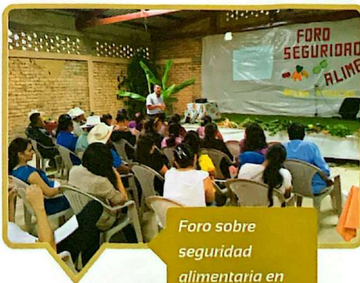
Foro sobre seguridad alimentaria en Belén Gualcho, Ocotepaque.

Antes de organizar las MMSSAN, se realizó un diagnóstico en el cual se identificaron los problemas, oportunidades y potenciales estrategias de cada uno de los municipios. A continuación presentamos el resumen.