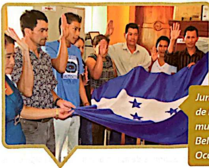
Juramentación de la mesa municipal en Belén Gualcho, Ocotepeque.

Quienes integran la MMSSAN participan en la reunión ordinaria de Corporación Municipal para la juramentación por parte de la alcaldesa o alcalde municipal y, al quedar en posesión de los cargos y juramentados, la Mesa se convierte en una organización reconocida legalmente en el municipio.