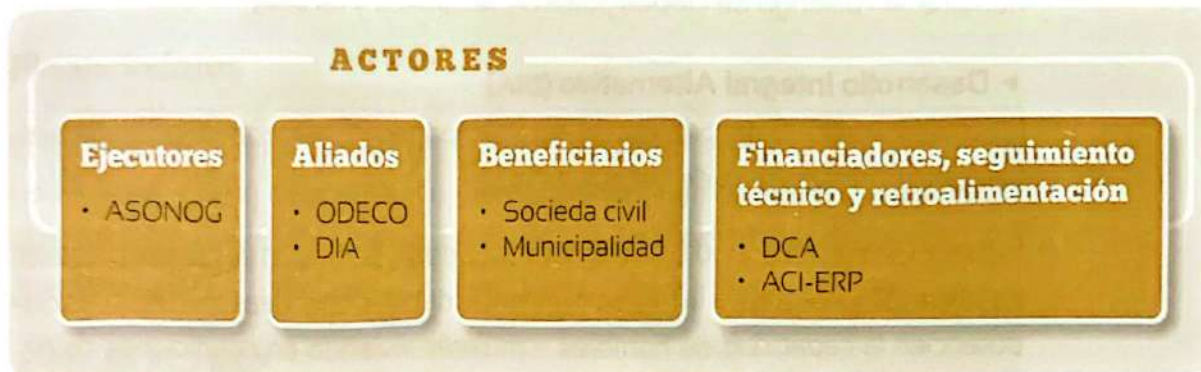
Figura 1 | actores de la experiencia

Durante el proceso de estructuración, organización y seguimiento de las MMSSAN, se involucran las siguientes organizaciones: